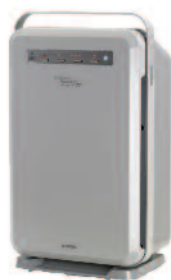
Air Wellness™ Power5 Pro™